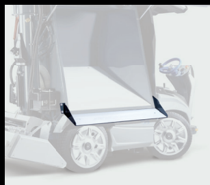
Prodloužení kluzné plochy