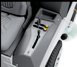
Hydraulické nastavení nože