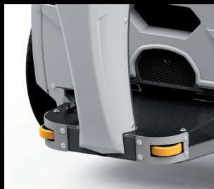
Ochranné kryty vodících válečků