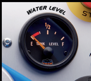
Ukazatel stavu vody