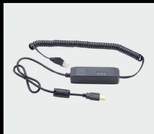
Diagnostický kabel Řídicí jednotka