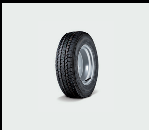
Rezervní kolo 12“