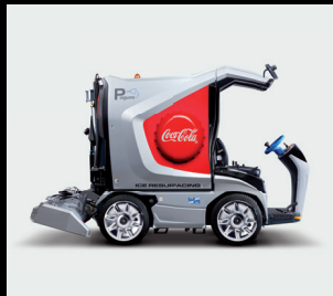
Vlastní design – polepení foliemi