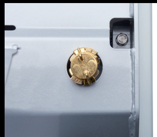
Tvättanordning horisontal skruv