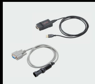
Diagnostisk kabel BMS