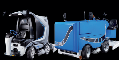
Mobile / Event