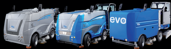
Pro / Heavy duty