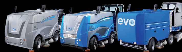
Prof / Heavy duty