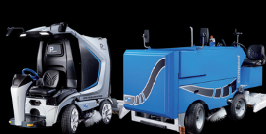
Mobiel / Event