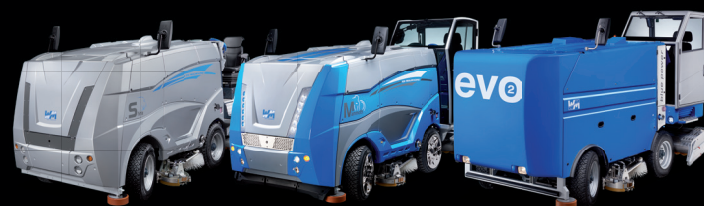
Prof / Heavy duty