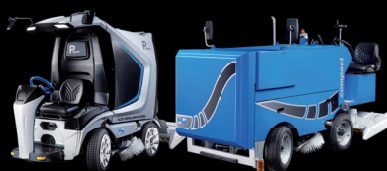
Mobiel / Event