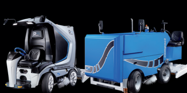
Мобильные катки / мероприятия на льду