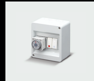
止水阀 配时间继电器