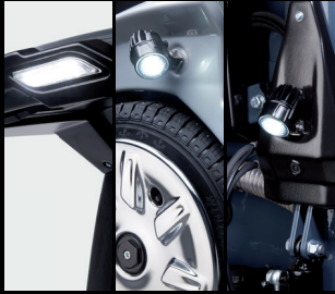
照明组件 头灯、尾灯、侧灯