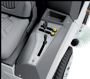
冰刀液压调节装置