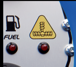
绞龙超载警示系统