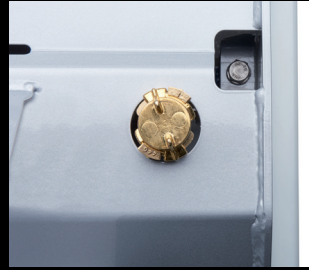
水平绞龙清洗系统