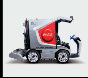
定制包装 4c数码印刷