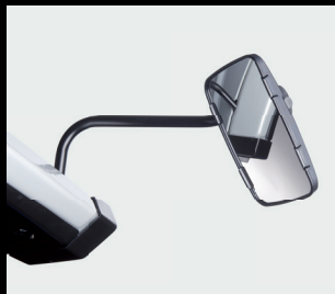
Seitenspiegel vorne links und rechts