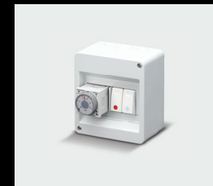
Acquastoppventil mit Zeitrelais