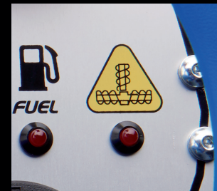
Warnsystem Überlastung Förderschnecken