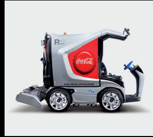
Folierung 4c Digitaldruck