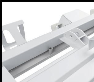
水平绞龙清洗系统