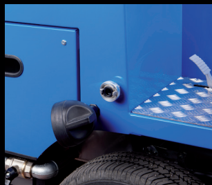
竖直卷龙冲洗系统