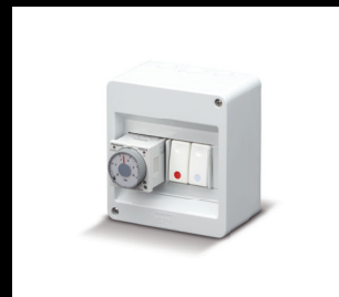
止水阀 配时间继电器