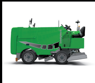
定制颜色车身漆 1 RAL 颜色