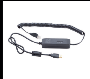
诊断电缆套件 控制器