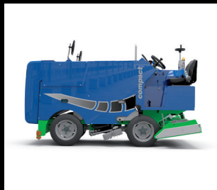
框架和刨削单元的油漆 单色RAL